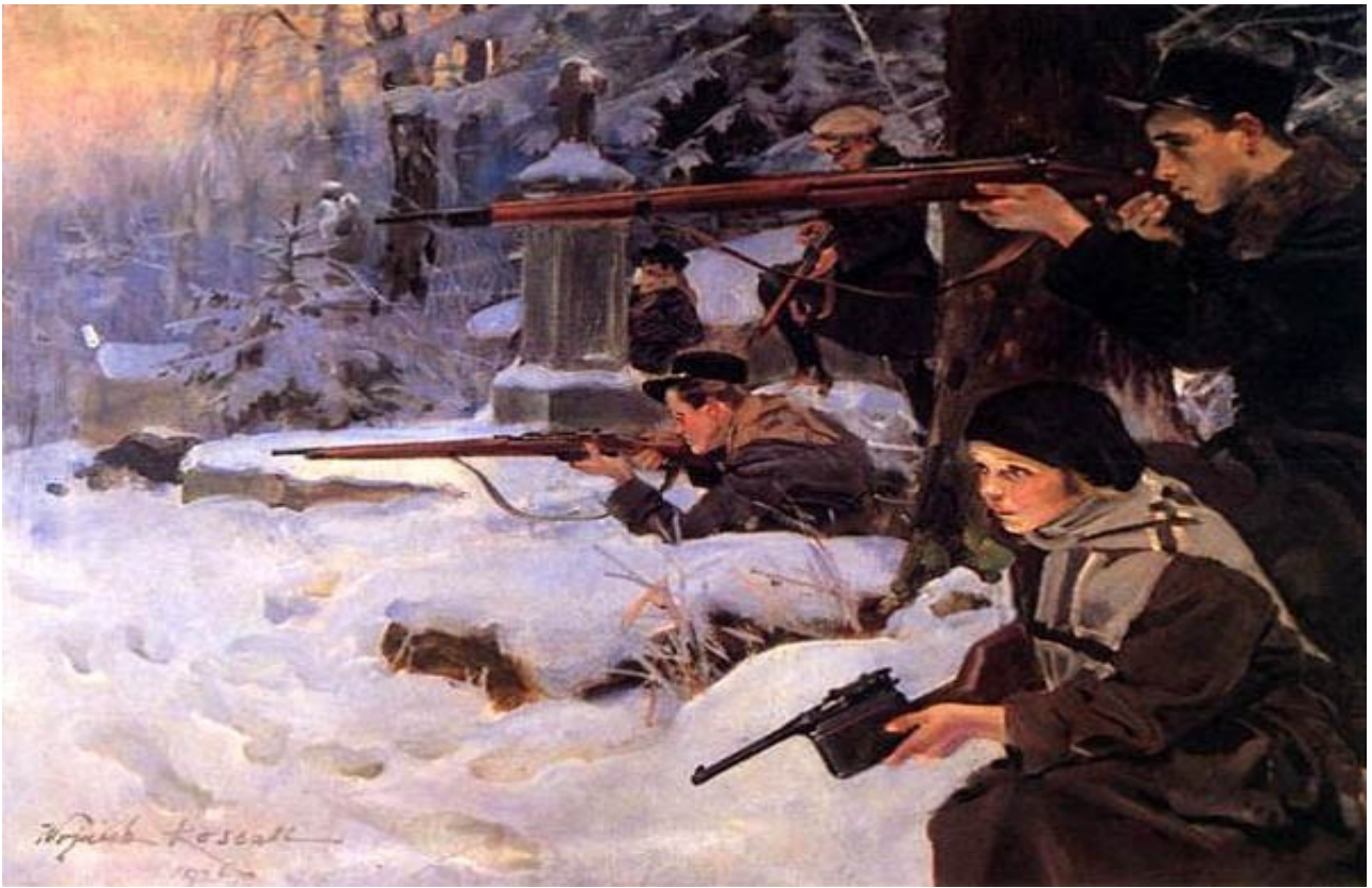
Львівські орлята з польської пропаганди.