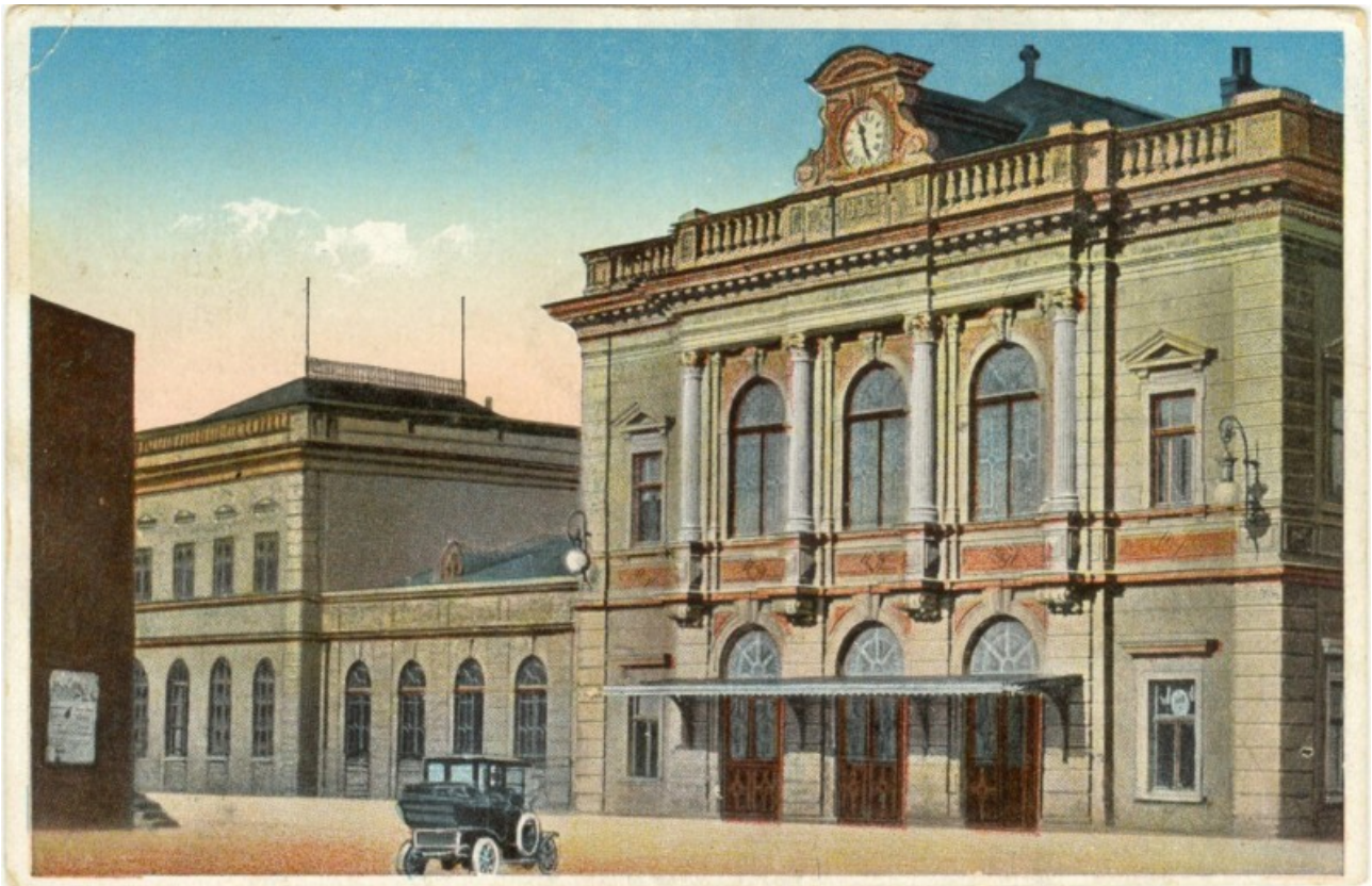
Залізничний двірець у Перемишлі.

Після того, як я видав начальнику Польської держави подальший розвиток подій, він трохи засумував. Я спеціально не робив різниці між подіями в рідних мені Галичині та Україні і в Польщі. Всі ці події були тісно взаємозв'язані. Відчайдушна Чортківська офензива і Чудо над Віслою, «пацифікація» та Волинська різня, Мюнхенська зрада Чехословаччини та «дивна війна» на Заході, оборона Вастерплатте та два Варшавських повстання, Майданек та операція Вісла, Голодомор та вбивство двадцяти тисяч полонених польських офіцерів вУкатині та під Харковом, полиці лише з оцтом у музеї Солідарності та катастрофа під Смоленськом... Саме вбивство всього польського керівництва росіянами та те, що Польща мовчки втерлася від плювка в обличчя і змовчала у відповідь, найбільше зачепило його шляхетський гонор. Якщо до цього часу я відчував внутрішній спротив цієї мужньої людини, то тепер він опустил напружені плечі та, поклавши на стіл широкі долоні, подивився зболеними очима прямо мені у вічі: