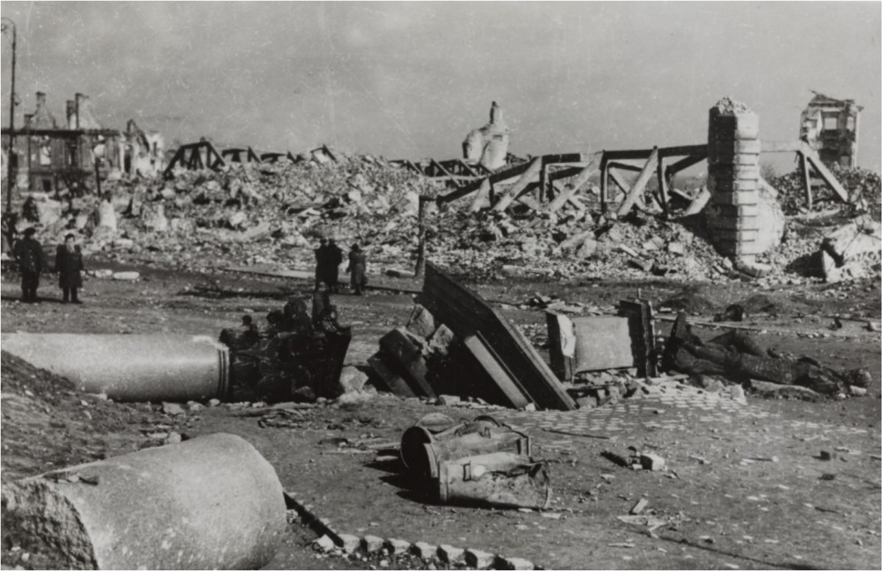
Руїни Королівського замку у Варшаві. 1945 рік.