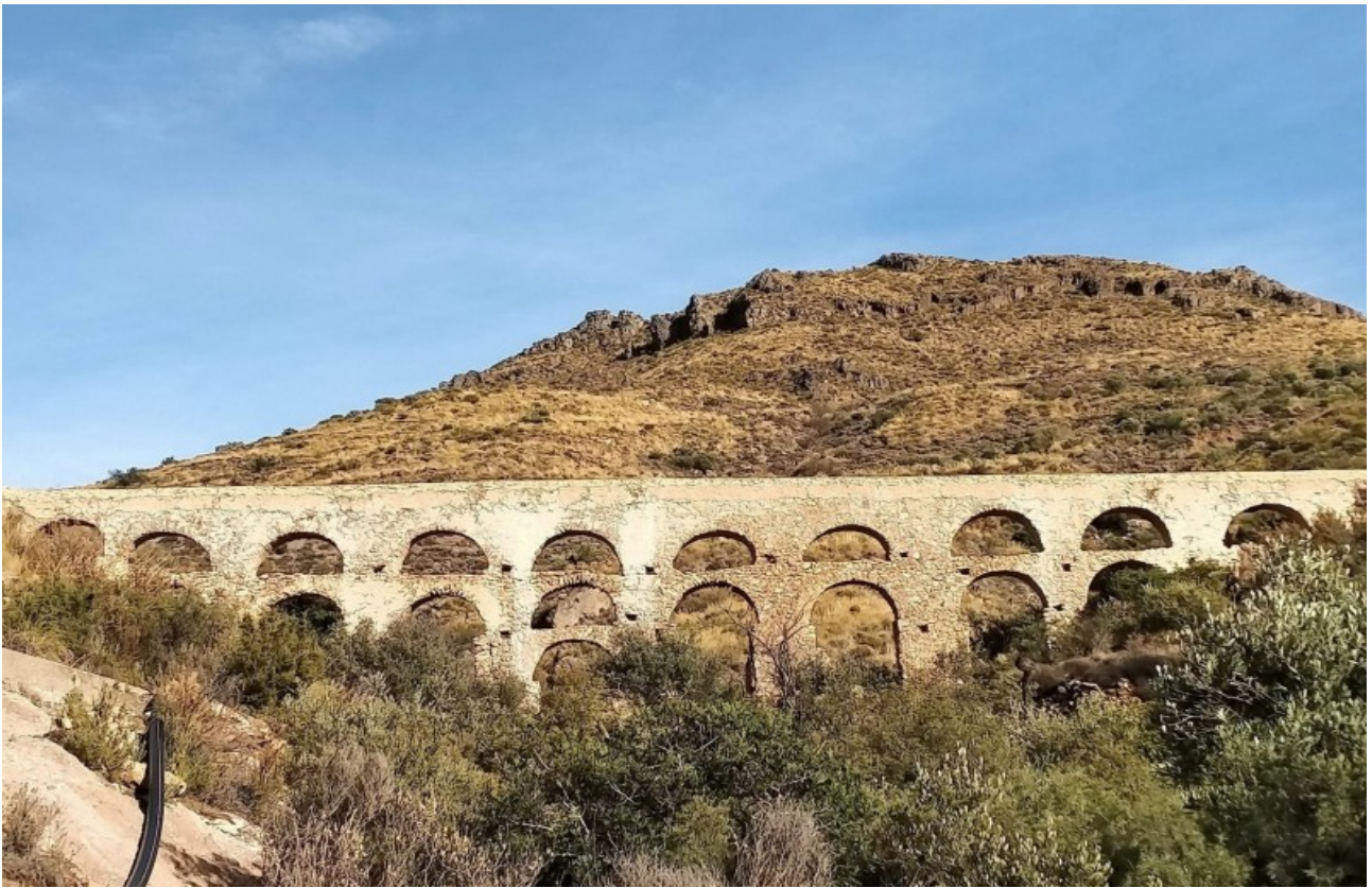
Акведук «20 очей»

Прийшли вони з дідусем сюди з протилежного боку і дорога там була досить важкою. Фактично, зараз Матвієві треба було десь із кілометр дертися по козячій стежці над проваллям, яка то стрімко спускалася вниз, то підскаувала різко вверх, а потім, скориставшись акведуком, як містком, зо три кілометри йти по асекільї – кам'яному каналу-кориту, в якому колись текла в долини вода з гірських джерел. Місцями вона була приліплена до скель, як лавстівчине гніздо, і годі було думати, щоб пронести там велосипед.