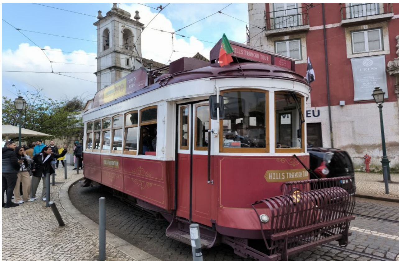
Трамвай у Лісабоні.