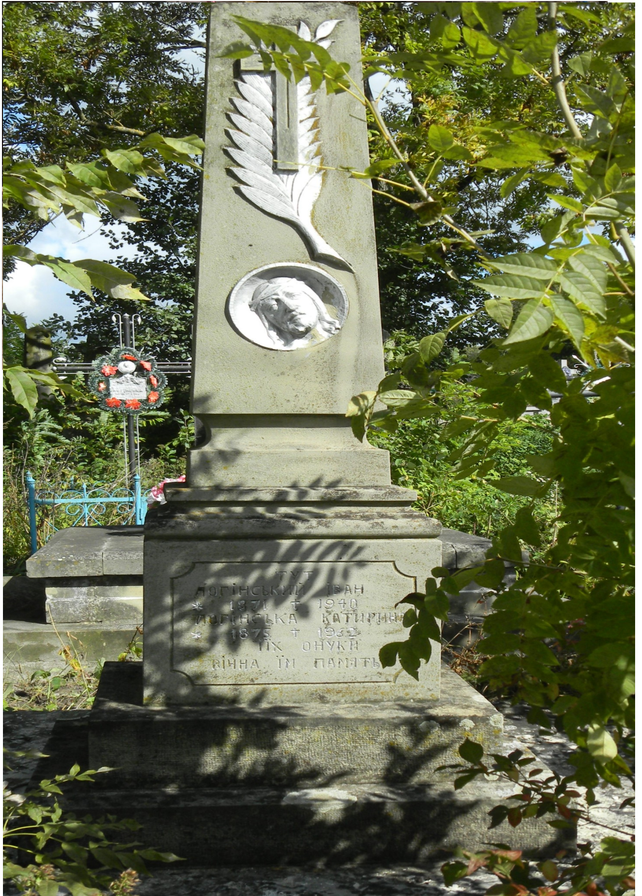
Присвячується моїм предкам, які жили на цій Богом даній нам землі.