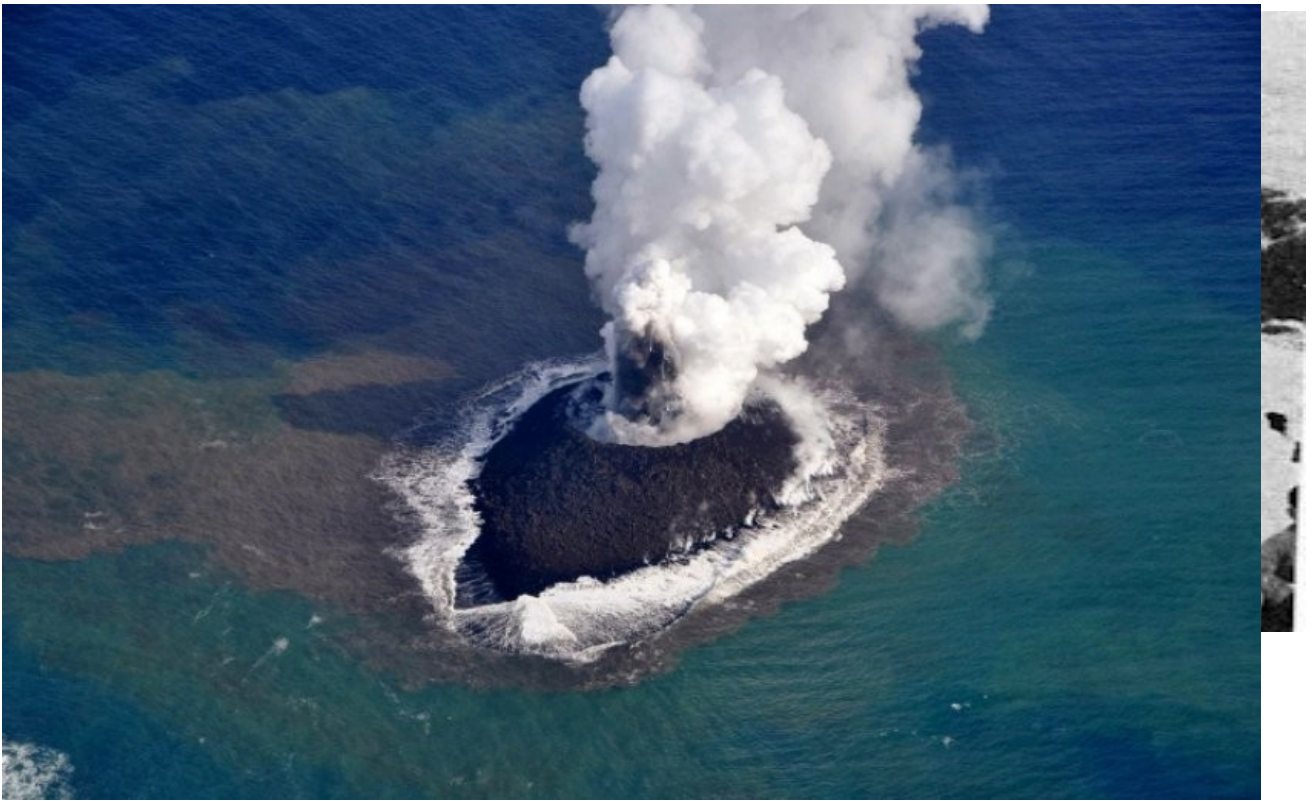
На Дорозі Смерті. 1937-й рік